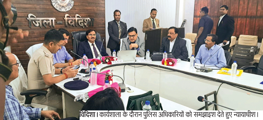
विदिशा। कार्यशाला के दौरान पुलिस अधिकारियों को समझाइश देते हुए न्यायाधीश।

जिला अभियोजन संचालनालय के तत्वाधान में शुक्रवार को पुलिस कंट्रोल रूम विदिशा में अभियोजन एवं पुलिस अधिकारियों की संयुक्त एक दिवसीय जिला स्तरीय कार्यशाला आयोजित की गई। कार्यशाला में विशेष न्यायाधीश