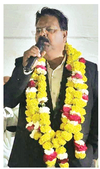
कानून का उल्लंघन है।

प्रश्न 4 क्या यह मामला कानूनी रूप से भी गंभीर है। उत्तर - बिल्कुल यह केवल प्रशासनिक लापरवाही नहीं बल्कि अनुसूचित जाति अत्याचार निवारण अधिनियम का उल्लंघन है। राष्ट्रीय स्तर पर भी आयोगों ने इसे मुद्दा बताया है। यदि किसी अनुसूचित जाति कर्मचारी का शोषण होता है तो यह सीधा