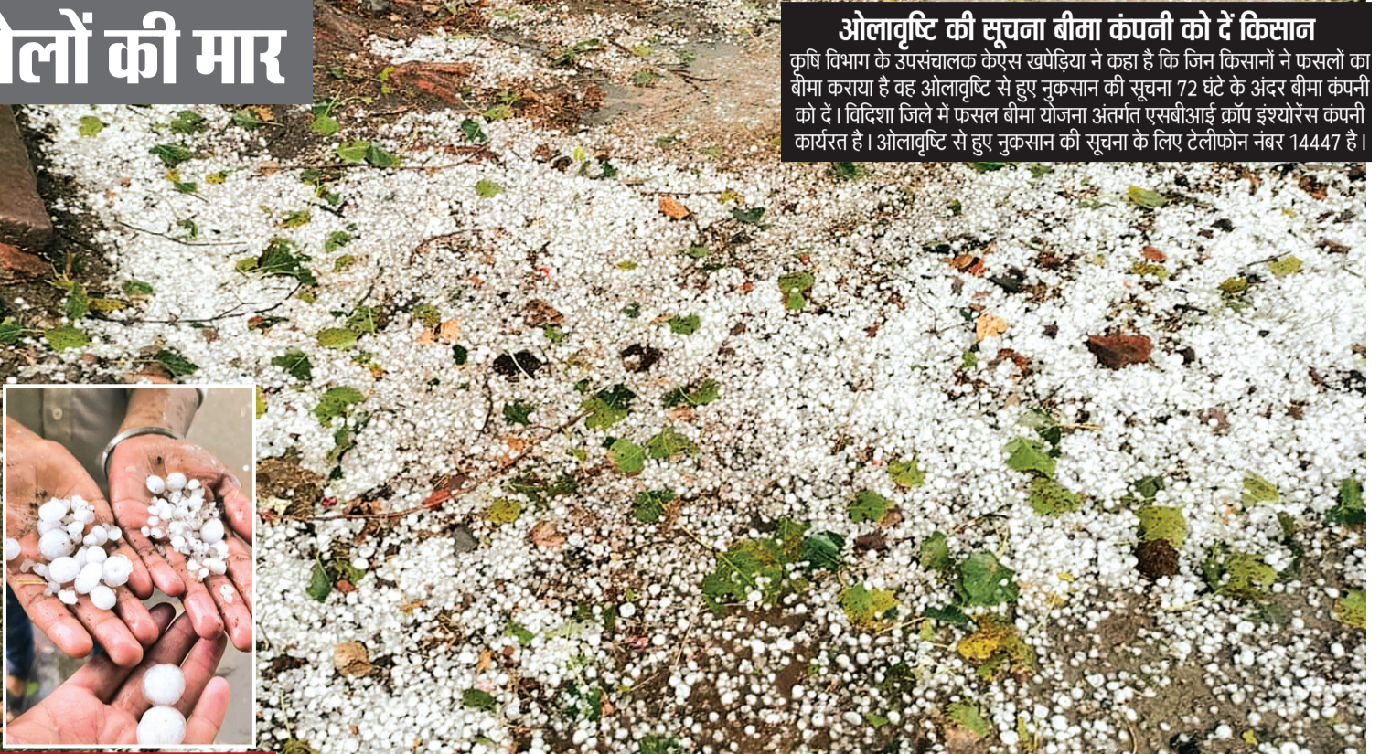
शमशाबाद के सांगुल सहित कई गांव में हुआ नुकसान