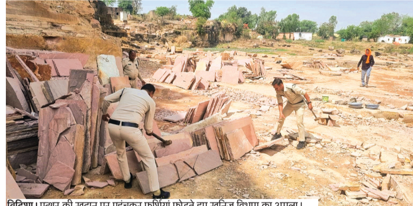
विदिशा। पत्थर की खदान पर पहुंचकर फर्शियां फोड़ते हुए खनिज विभाग का अमला।

उत्खनन में प्रयुक्त हथौड़े, डैनी, सबल, गुनिया आदि उपकरण भी जब्त कर लिए गए हैं। प्रभारी खनिज अधिकारी ने बताया कि जिले में भ्रमण के दौरान 2 डंपरों द्वारा खनिज मुरम का अवैध परिवहन करते पाए जाने पर डंपरों को जब्त कर पुलिस थाना कार्रवाई एवं नटेरन में खड़ा कराया गया है। जिनके प्रकरण कलेक्टर न्यायालय में प्रस्तुत किए जाने की कार्रवाई की जाएगी। जिले में रेत खदानों से खनन पर प्रतिबंध होने के कारण इनकी भी निगरानी की जा रही है। कलेक्टर ने ग्रामीण क्षेत्र के अधिकारियों को निर्देश दिए हैं कि उनके क्षेत्र में अवैध रेत खनन और परिवहन पर नजर रखी जाए और सूचना मिलने पर तत्काल कार्रवाई की जाए।