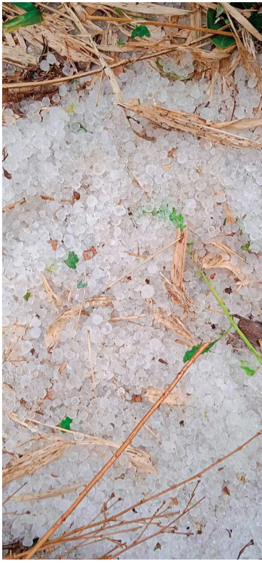
हरिभूमि न्यूज | रायसेन

जिले में मौसम ने अचानक करवट लेते हुए किसानों की चिंता को बढ़ा दी है। शुक्रवार की बीती रात को शहर सहित जिलेभर में हुई बेमौसम बारिश ने जहां एक ओर बढ़ती गर्मी पर ब्रेक लगा दिया। वहीं खेतों में खड़ी रबी सीजन की फसलों को नुकसान पहुंचाने की खबरें भी सामने आने लगी हैं। कई इलाकों में तेज हवा के साथ बारिश हुई, जिससे गेहूं, चना, मसूर और सरसों की फसल प्रभावित हुई है। जिला मौसम विभाग ने आगामी 24 से 48 घंटों में ओलावृष्टि की भी संभावना जताई है, जिससे किसानों की चिंता और बढ़ गई है। बारिश के चलते दिनभर आसमान में बादल छाए रहे और तापमान में 3 से 5 डिग्री सेल्सियस तक की गिरावट दर्ज की गई। पिछले कुछ दिनों से जहां तेज धूप और गर्मी का असर बढ़ रहा था। वहीं अचानक बदले मौसम ने लोगों को राहत भी दी। हालांकि किसानों के लिए यह राहत ज्यादा देर तक सुकून नहीं दे पाई। क्योंकि फसल कटाई के समय हुई बारिश नुकसानदायक साबित हो रही है।